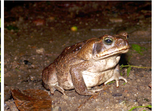
3 Rhinella marina BUFONIDAE Sapo, Sapo de caña, Sapo común