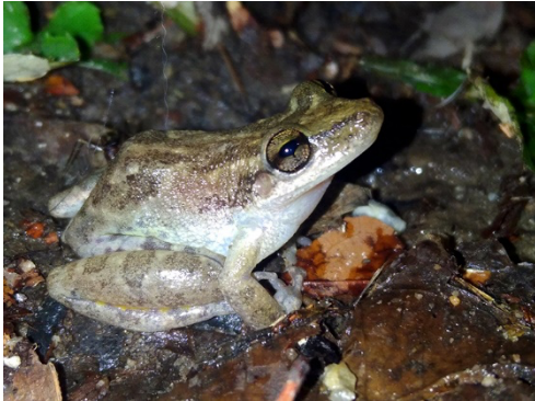
10 Scinax sp. HYLIDAE Rana Rostral

[science.fieldmuseum.org/fieldguides] [1810] versión 1 5/2026