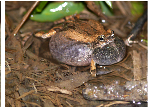
15 Engystomops pustulosus LEPTODACTYLIDAE Rana Túngara