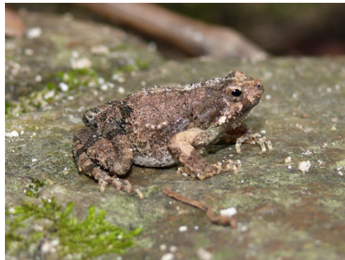
14 Engystomops pustulosus LEPTODACTYLIDAE Rana Túngara