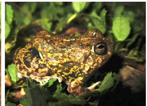
18 Pleurodema brachyops LEPTODACTYLIDAE Sapito Lipon