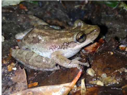
11 Scinax sp. HYLIDAE Rana Rostral