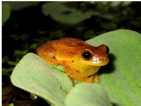
8 Dendrosophus microcephalus HYLIDAE Rana Minuscula