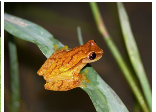
9 Dendrosophus microcephalus HYLIDAE Rana Minuscula