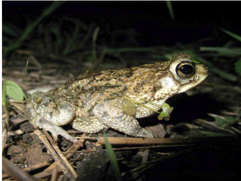
1 Rhinella humboldti BUFONIDAE Sapo de Humboldt

[science.fieldmuseum.org/fieldguides] [1810] versión 1 5/2026