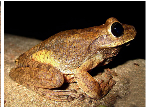
6 Boana pugnax HYLIDAE Rana Platanera