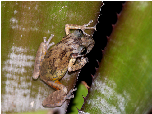
13 Scinax-x-signatus HYLIDAE Tuquí