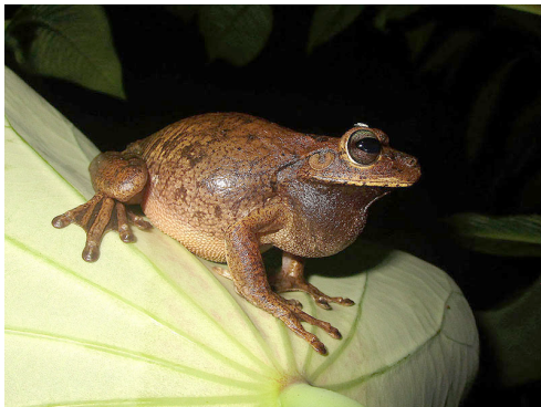
7 Boana pugnax HYLIDAE Rana Platanera