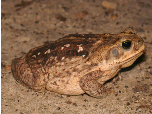
4 Rhinella marina BUFONIDAE Sapo, Sapo de caña, Sapo común