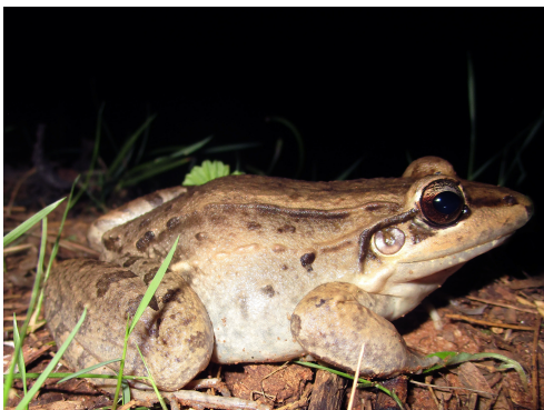
16 Leptodactylus bolivianus LEPTODACTYLIDAE Rana Silbadora