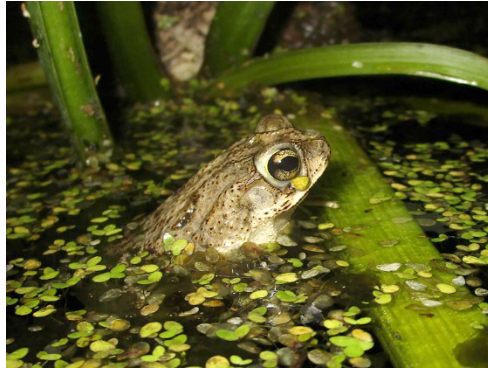
2 Rhinella humboldti BUFONIDAE Sapo de Humboldt