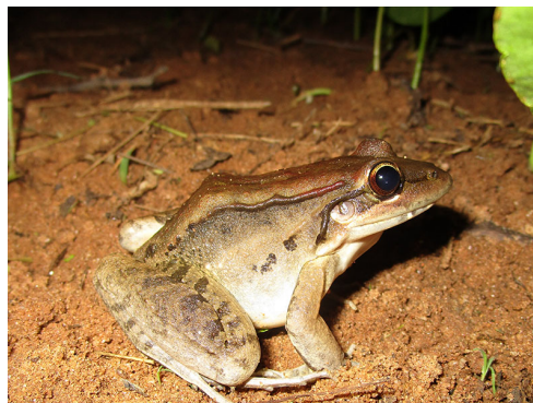
17 Leptodactylus bolivianus LEPTODACTYLIDAE Rana Silbadora