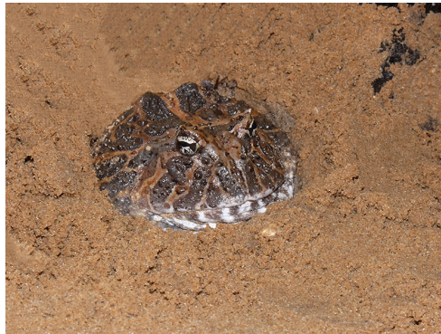
5 Ceratothryx calcarata CERATOPHRYIDAE Rana Cornuda