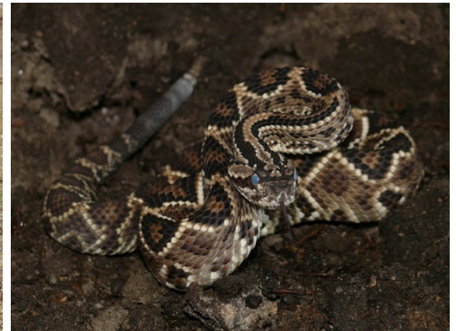
52 Crotalus durissus VIPERIDAE Cascabel