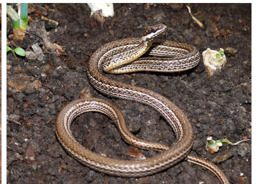
28 Mastigodryas pleii COLUBRIDAE Cazadora rayada, Sabanera