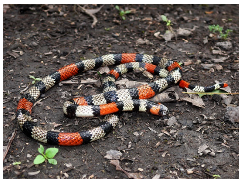
45 Micrurus isozonus ELAPIDAE Coral llanera