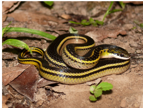
18 Erythrolamprus melanotus COLUBRIDAE Reinita