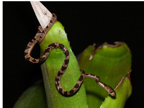
21 Imantodes cenchoa COLUBRIDAE Bejuquilla, Latigo