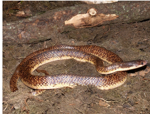
33 Phimophis guianensis COLUBRIDAE Excavadora, Minadora