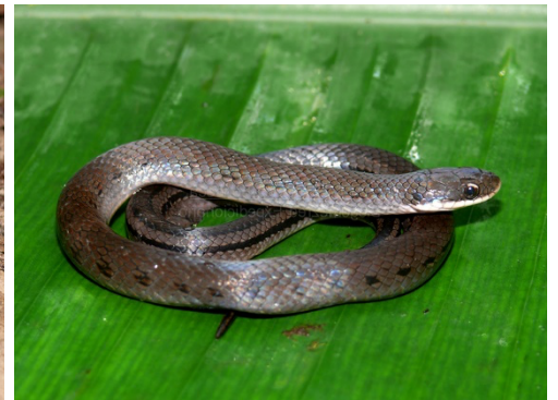
19 Erythrolamprus mertensi COLUBRIDAE Reinita