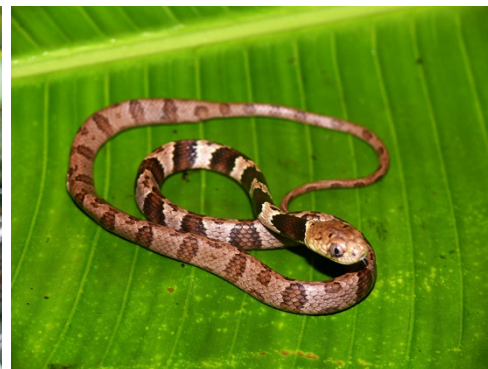
12 Dipsas latifrontalis COLUBRIDAE Caracolera, Falsa mapanare