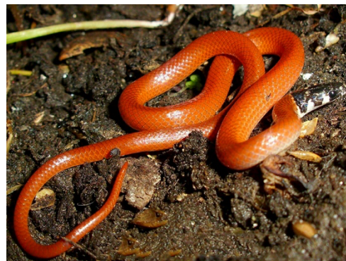
39 Tantilla melanocephala COLUBRIDAE Falsa coral