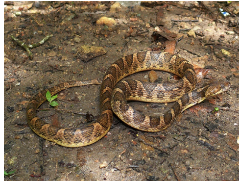
24 Leptodeira ashmeadii COLUBRIDAE Falsa mapanare