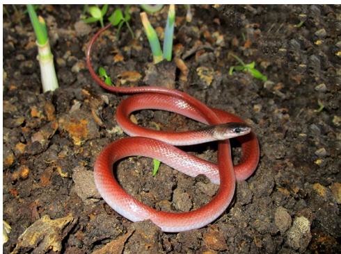
35 Pseudoboia newiedii COLUBRIDAE Coral macho (falsa)