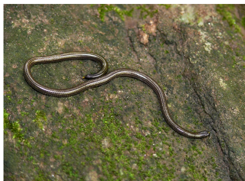
47 Epictia fallax LEPTOTYPHLOPIDAE Cieguita