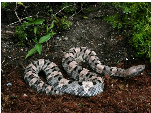
53 Porthidium lansbergii VIPERIDAE Mapanare saltona