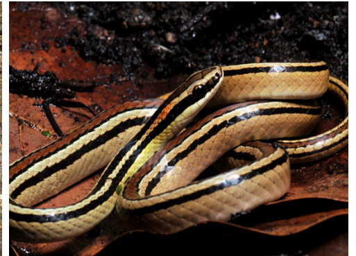
25 Lygophis lineatus COLUBRIDAE Serpiente arrocera