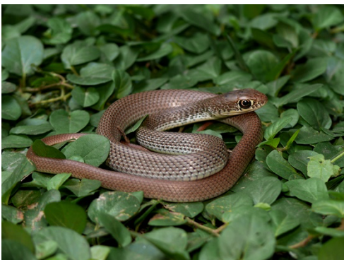
26 Masticophis mentovarius COLUBRIDAE Cazadora, Conejera, Sabanera