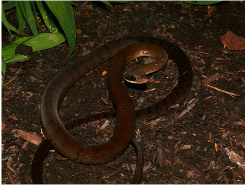
14 Dendrophidion nuchale COLUBRIDAE Cazadora manchada, Machete