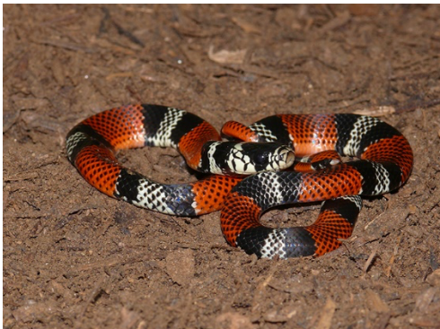
17 Erythrolamprus bizona COLUBRIDAE Falsa coral