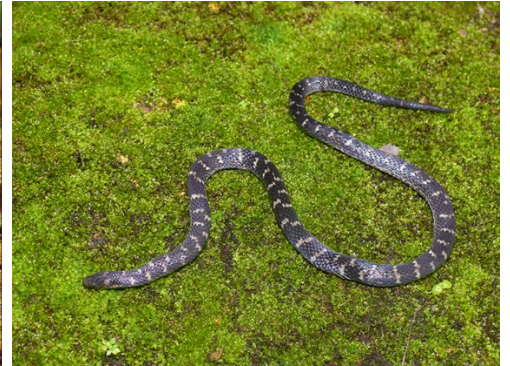
7 Atractus lancinii BOIDAE Falsa coral