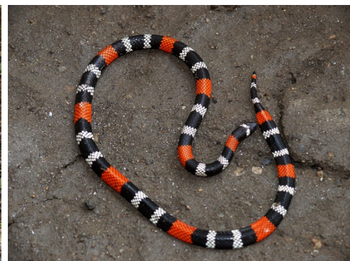
43 Micrurus dissoleucus ELAPIDAE Coral capuchina