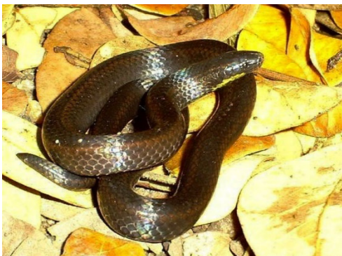
8 Atractus vittatus COLUBRIDAE Tierrezera