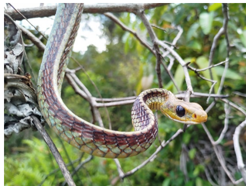
11 Chironius spixii BOIDAE Lora