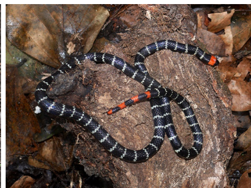
46 Micrurus mipartitus ELAPIDAE Coral rabo de ají