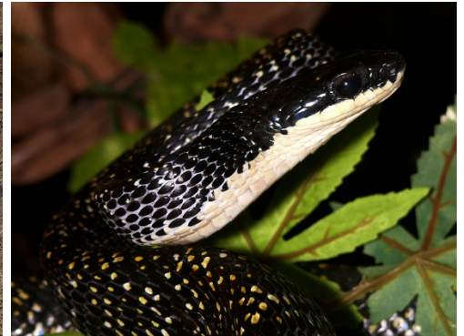
34 Phrynonax shropshirei COLUBRIDAE Cesta