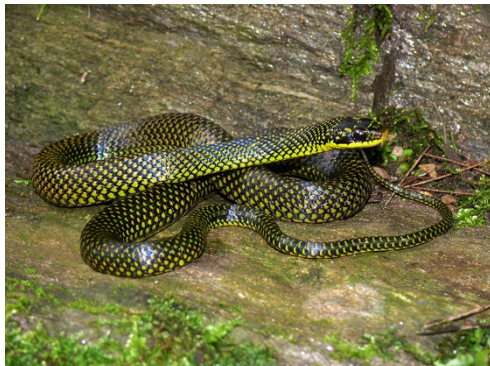
20 Erythrolamprus zwefeli COLUBRIDAE Reinita