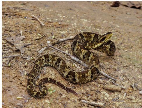
51 Bothrops venezuelensis VIPERIDAE Tigra mariposa