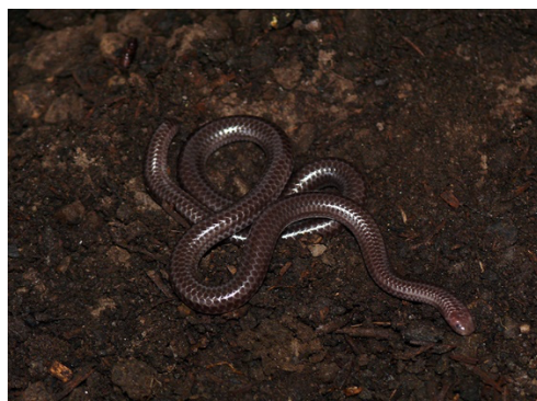
48 Trilepida macrolepis LEPTOTYPHLOPIDAE Cieguita