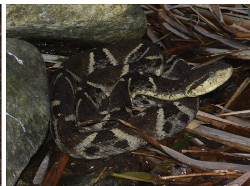
49 Bothrops atrox VIPERIDAE Mapanare