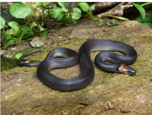
29 Ninia atrata COLUBRIDAE Culebra de tierra