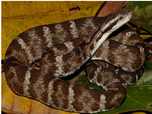
50 Bothrops medusa VIPERIDAE Mapanare viejita