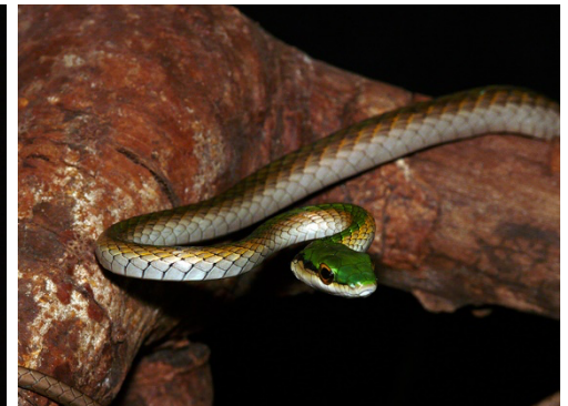
22 Leptophis coeruleodorsus COLUBRIDAE Verdegallo