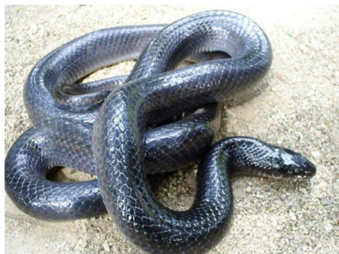
9 Clelia clelia COLUBRIDAE Tuquí, Ratonera, Cazadora negra