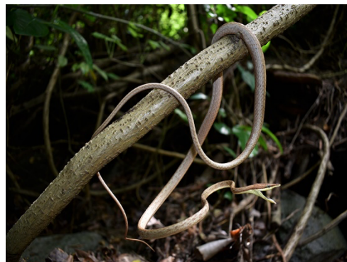
30 Oxybelis rutherfordi COLUBRIDAE Bejuca