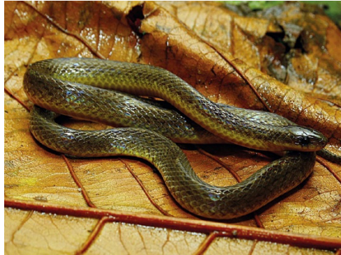
6 Atractus fuliginosus COLUBRIDAE Tierrezera