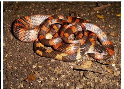
31 Oxyrhopus petolaris COLUBRIDAE Falsa coral