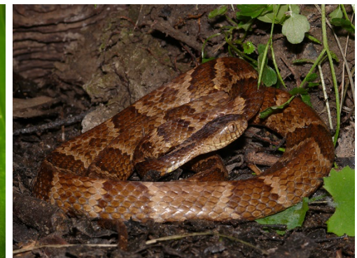
13 Dipsas variegata COLUBRIDAE Caracolera, Falsa mapanare