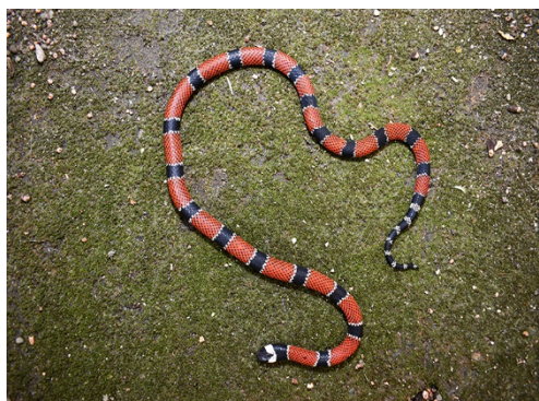
44 Micrurus dumerili ELAPIDAE Coral capuchina