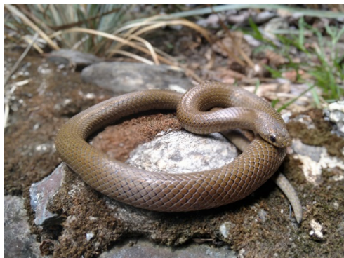
38 Stenorrhina degenhardtii COLUBRIDAE Alacranera