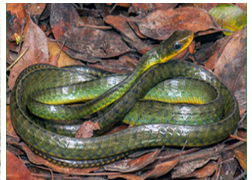
10 Chironius septentrionalis COLUBRIDAE Lora