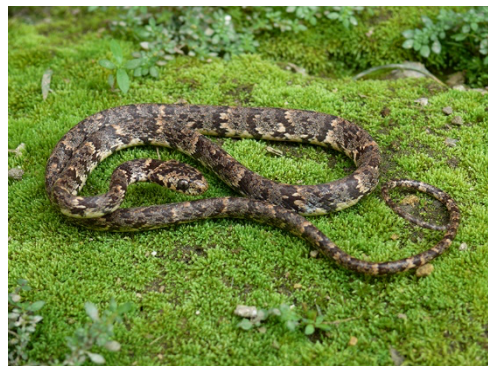
36 Sibon nebulatus COLUBRIDAE Caracolera