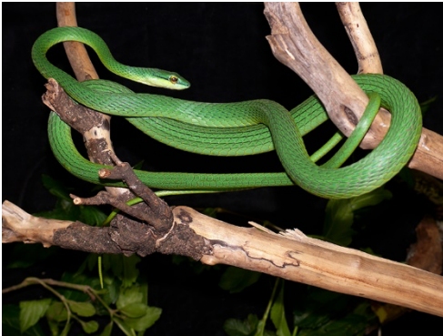
23 Leptophis occidentalis COLUBRIDAE Verdegallo