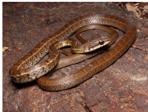
27 Mastigodryas boddaerti COLUBRIDAE Cazadora, Sabanera