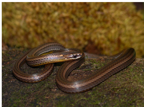
41 Urotheca multilineata COLUBRIDAE Cazadora rayada