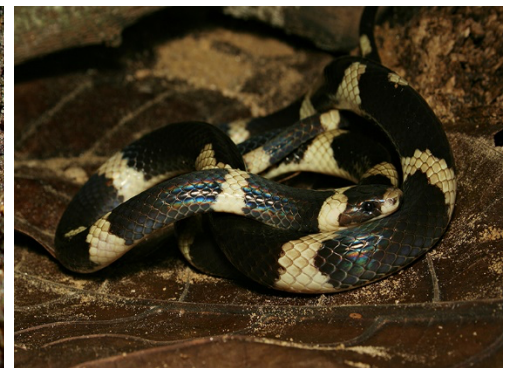
40 Tantilla semicineta COLUBRIDAE Cazadora rayada