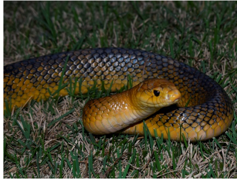
15 Drymarchon corais COLUBRIDAE Cazadora rabo amarillo