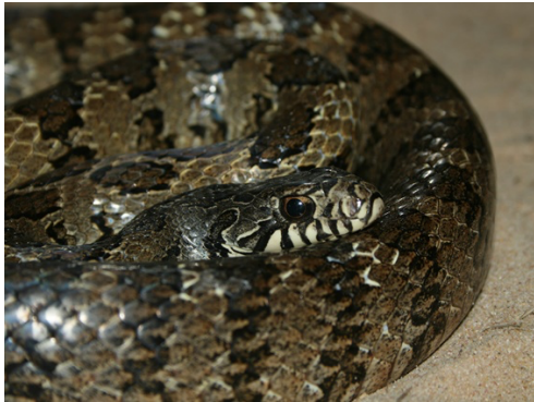
32 Palusophis bifossatus COLUBRIDAE Cazadora