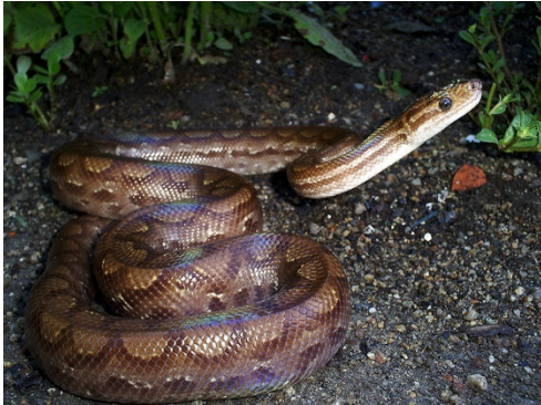
5 Epicrates maurus BOIDAE Boa tornasol