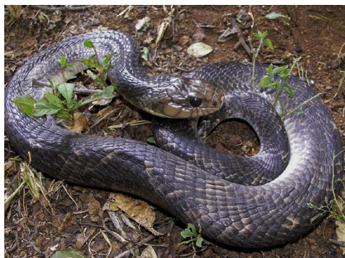
42 Xenodon severus COLUBRIDAE Falsa mapanare, Sapa, Sapamanare