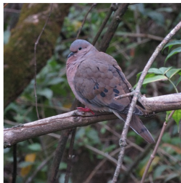
7 Zenaida auriculata COLUMBIDAE Tórtola orejuda