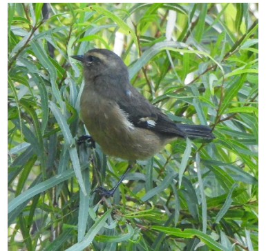
21 Conirostrum cinereum THRAUPIDAE Picocono Cinéreo