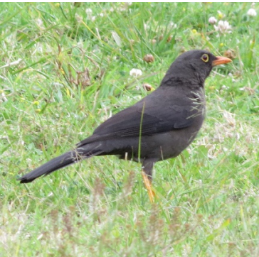
30 Turdus fuscater (M) TURDIDAE Mirlo Grande