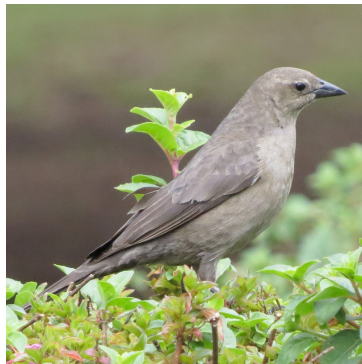
19 Molothrus bonariensis (H) ICTERIDAE Vaquero Brilloso