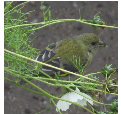
17 Sporagra magellanica (H) FRINGILLIDAE Jilguero Encapuchado