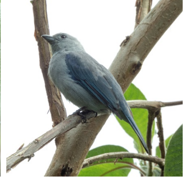
25 Thraupis episcopus THRAUPIDAE Tangara Azuleja