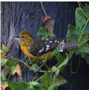
6 Pheucticus chrysogaster (H) CARDINALIDAE Picogrueso Amarillo Sureño