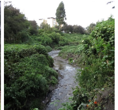
33 Quebrada Shanshayacu y Remanente de Vegetación Nativa de Ribera.