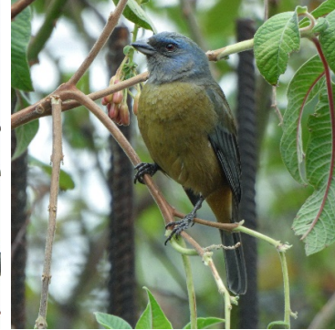
24 Rauenia bonariensis (M) THRAUPIDAE Tangara Azuliamarilla