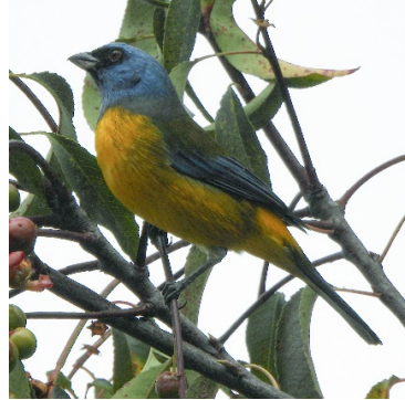
23 Rauenia bonariensis (M) THRAUPIDAE Tangara Azuliamarilla