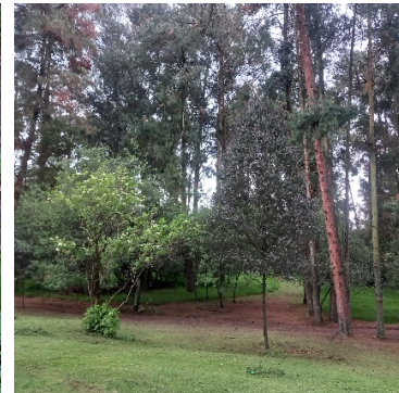
32 Jardines y Bosques Internos del Parque de Especies de Plantas Introducidas