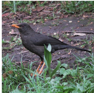
31 Turdus fuscater (H) TURDIDAE Mirlo Grande