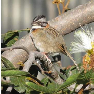
10 Zonotrichia capensis EMBERIZIDAE Gorrión Criollo