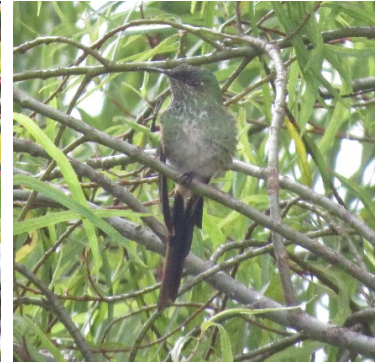
29 Lesbia victoriae (H) TROCHILIDAE Colacintillo Colinegro