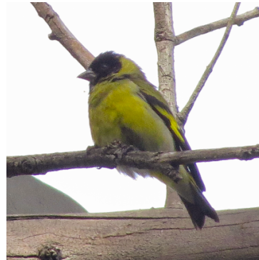
16 Sporagra magellanica (M) FRINGILLIDAE Jilguero Encapuchado