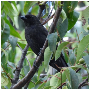
18 Molothrus bonariensis (M) ICTERIDAE Vaquero Brilloso