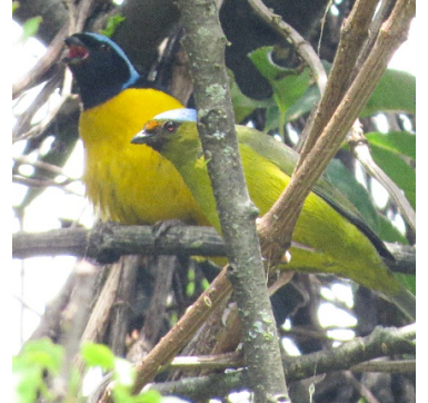
13 Euphonia cyanocephala FRINGILLIDAE Eufoni Lomidorada