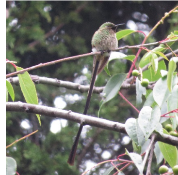
28 Lesbia victoriae (M) TROCHILIDAE Colacintillo Colinegro