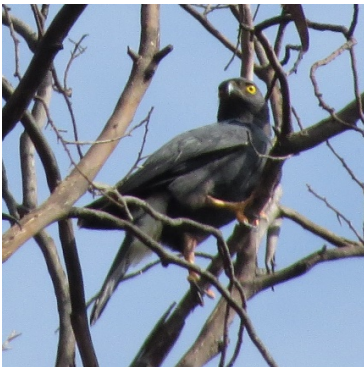
2 Parabuteo leucorrhous ACCIPITRIDAE Gavián Lomiblanco