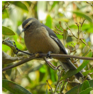
20 Conirostrum cinereum THRAUPIDAE Picocono Cinéreo