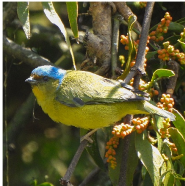
15 Euphonia cyanocephala (H) FRINGILLIDAE Eufoni Lomidorada