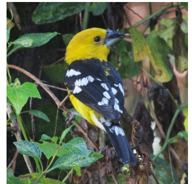
5 Pheucticus chrysogaster (M) CARDINALIDAE Picogrueso Amarillo Sureño