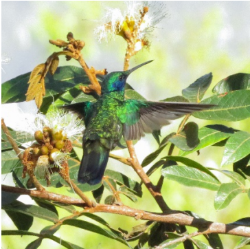
26 Colibri coruscans TROCHILIDAE Orejivioleta Ventriazul