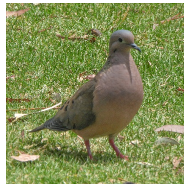
8 Zenaida auriculata COLUMBIDAE Tórtola orejuda