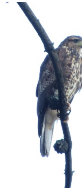
4 Parabuteo unicinctus (Juv.) ACCIPITRIDAE Gavián Alicastaño