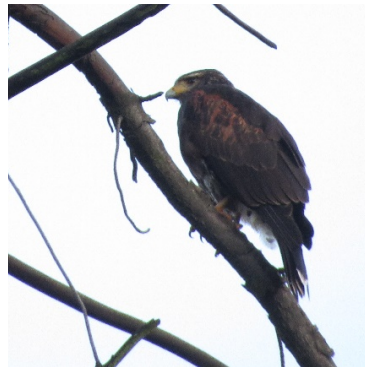
3 Parabuteo unicinctus ACCIPITRIDAE Gavián Alicastaño