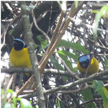
14 Euphonia cyanocephala (M) FRINGILLIDAE Eufoni Lomidorada