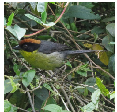
9 Atlapetes latinuchus EMBERIZIDAE Matorralero Nuquirrufo