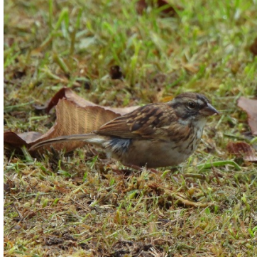
11 Zonotrichia capensis (Juv.) EMBERIZIDAE Gorrión Criollo