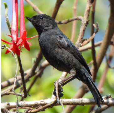
22 Diglossa humeralis THRAUPIDAE Pinchaflores Negro