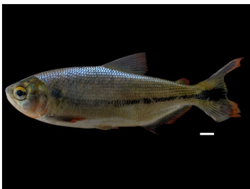
14 Brycon whitei BRYCONIDAE Palambra