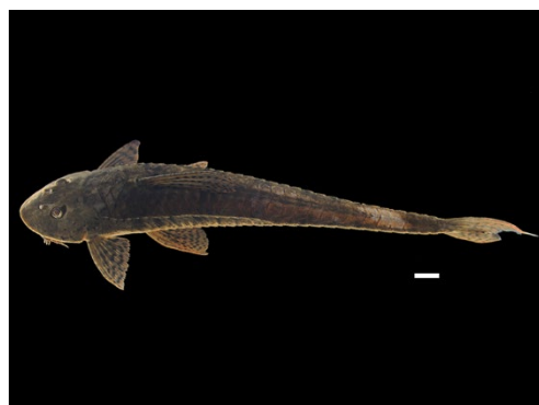
58 Loricariichthys brunneus LORICARIIDAE Alcalde