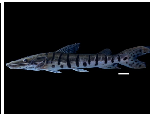
63 Pseudoplatystoma orinocoense PIMELODIDAE Bagre rayado