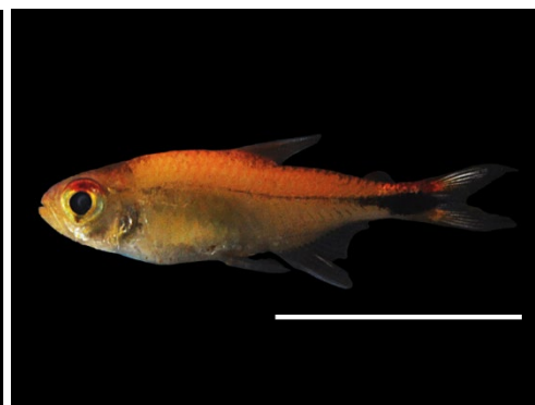
3 Axelrodia riesei ACESTORRHAMPHIDAE Tetra