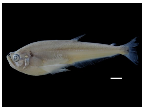
41 Cynodon gibbus CYNODONTIDAE Payarin/Palandria