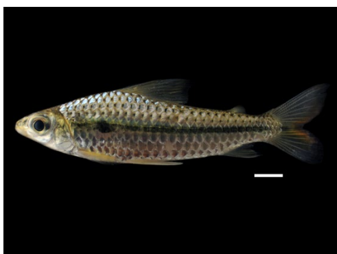
22 Caenotropus labyrinthicus CHILODONTIDAE Coporito