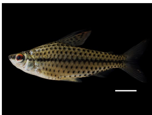
23 Chilodus punctatus CHILODONTIDAE Chilodus/Coporito