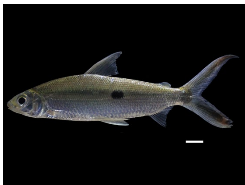
49 Hemiodus unimaculatus HEMIODONTIDAE Salton