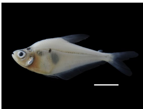
20 Charax apurensis CHARACIDAE Sardina