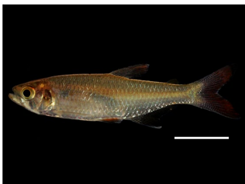
19 Aphyocharax erythrurus CHARACIDAE Sardina

[science.fieldmuseum.org/fieldguides] [1704] versión 1 12/2025