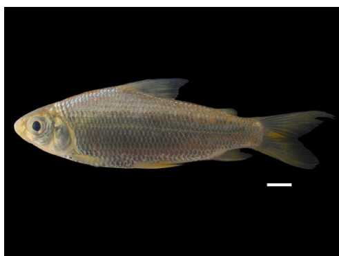
40 Steindachnerina pupula CURIMATIDAE Coporo