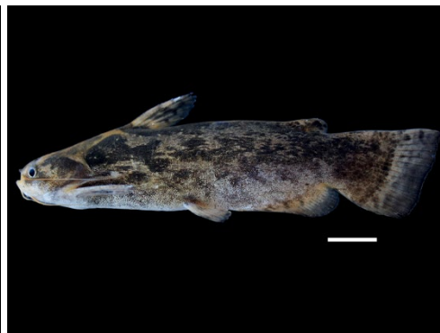
12 Trachelyopterus galeatus AUCHENIPTERIDAE Torito