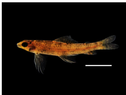
34 Melanocharacidium cf. dispilomma CRENUCHLIDAE Marranito