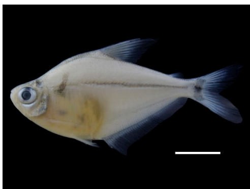
4 Ctenobrycon spilurus ACESTORRHAMPHIDAE Sardina