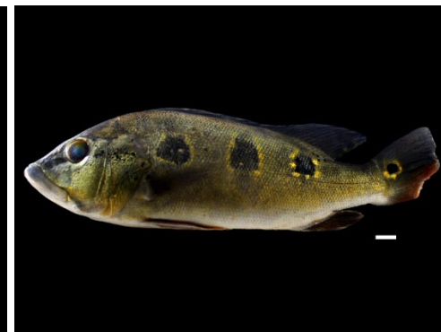
27 Cichla orinocensis CICHLIDAE Pávon