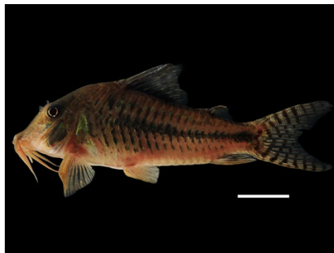
17 Hoplisoma sp. CALLICHTHYIDAE Corredora