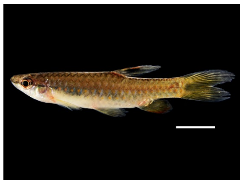
55 Pyrrhulina lugubris LEBIASINIDAE Voladorita

[science.fieldmuseum.org/fieldguides] [1704] versión 1 12/2025