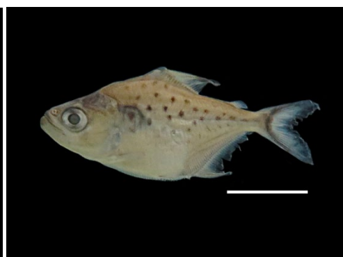
69 Serrasalmus medinae SERRASALMIDAE Caribe/Piraña