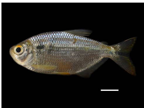
1 Astyanax aff. bimaculatus ACESTORRHAMPHIDAE Sardina

[science.fieldmuseum.org/fieldguides] [1704] versión 1 12/2025