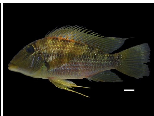
30 Satanoperca mapiritensis CICHLIDAE Juan viejo