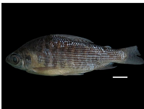
65 Prochilodus mariae PROCHILODONTIDAE Coporo/Bocachico