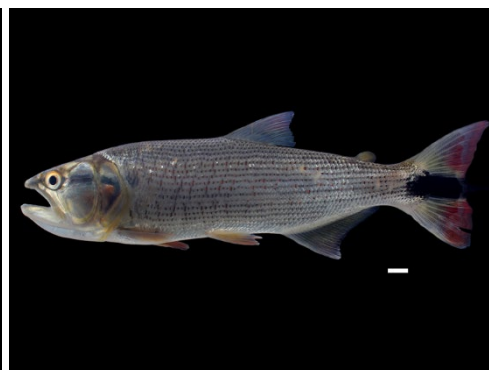
15 Salminus iquitensis BRYCONIDAE Dientón/Bocona