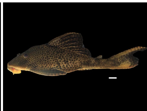
57 Hypostomus sp. LORICARIIDAE Cucha/Corroncho