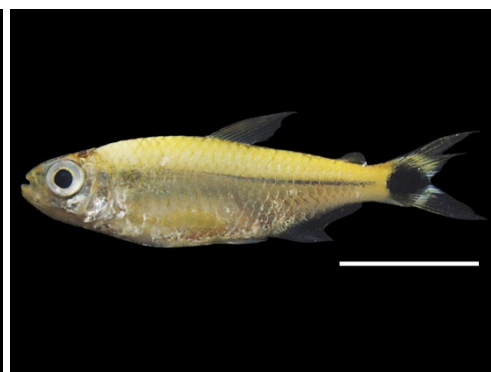
6 Ramirezella newboldi ACESTORRHAMPHIDAE Tetra