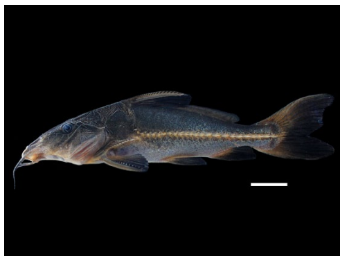
43 Oxydoras sifontesi DORADIDAE Sierra copora