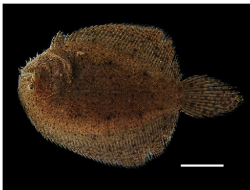
8 Achirus novoae ACHIRIDAE Lenguado/Pez hoja