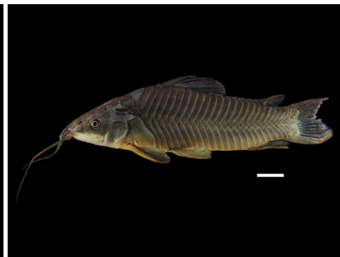
18 Hoplosternum littorale CALLICHTHYIDAE Curito