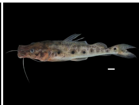
60 Hemisorubim platyrhynchos PIMELODIDAE Gata/Doncella