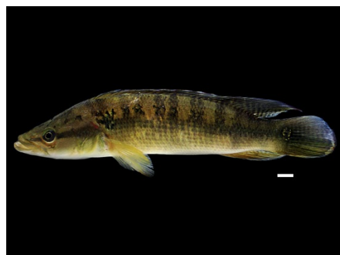
31 Saxatilia sveni CICHLIDAE Mataguaro/Bocón