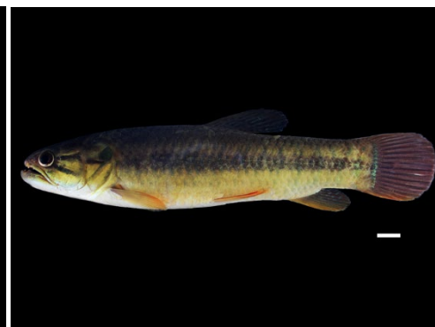
45 Hoplerthrinus unitaeniatus ERYTHRINIDAE Chúbano