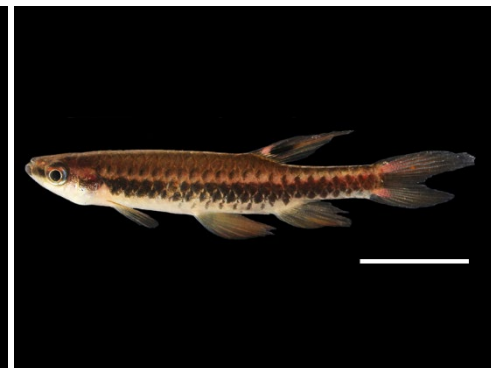
54 Copella eigenmanni LEBIASINIDAE Marranito