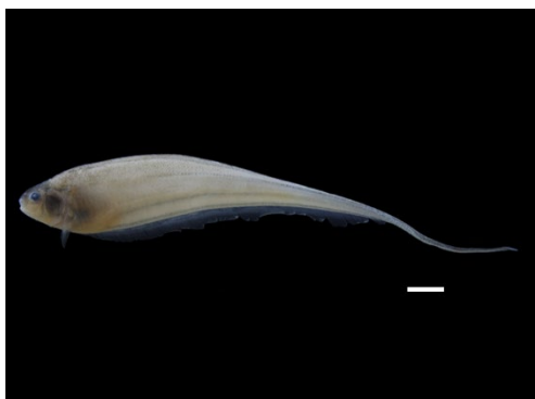
70 Eigenmannia cf. limbata STERNOPYGIDAE Cuchillo