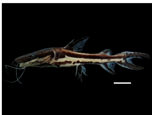
64 Pseudoplatystoma sp. (Juvenil) PIMELODIDAE Bagre

[science.fieldmuseum.org/fieldguides] [1704] versión 1 12/2025