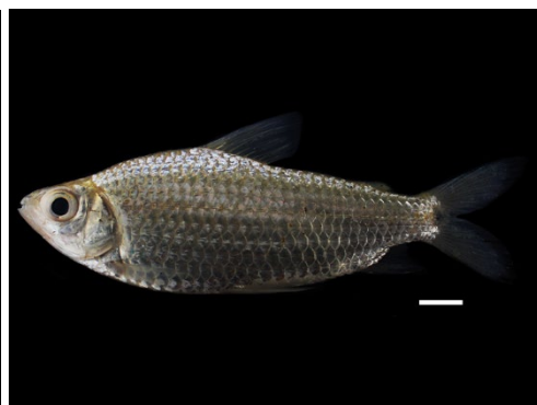
36 Curimatella immaculata CURIMATIDAE Coporo