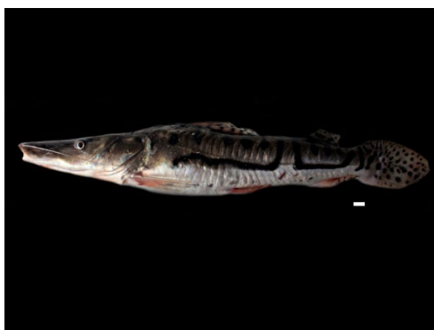
62 Pseudoplatystoma metaense PIMELODIDAE Bagre