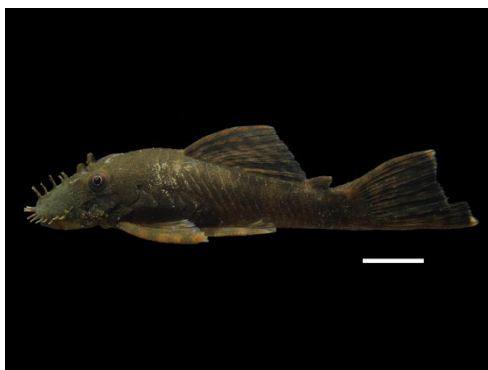
56 Ancistrus triradiatus LORICARIIDAE Cucha