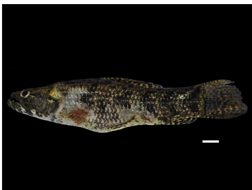
46 Hoplias malabaricus ERYTHRINIDAE Guabina

[science.fieldmuseum.org/fieldguides] [1704] versión 1 12/2025