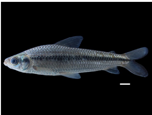
11 Schizodon scotorhabdotus ANOSTOMIDAE Tuso/Platanote