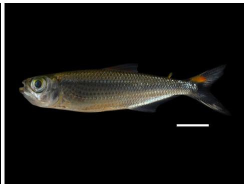
53 Bryconops giacopinii IGUANODECTIDAE Sardina