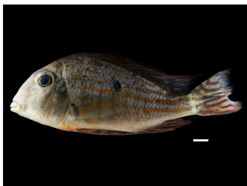
28 Geophagus abalios CICHLIDAE Juan viejo

[science.fieldmuseum.org/fieldguides] [1704] versión 1 12/2025