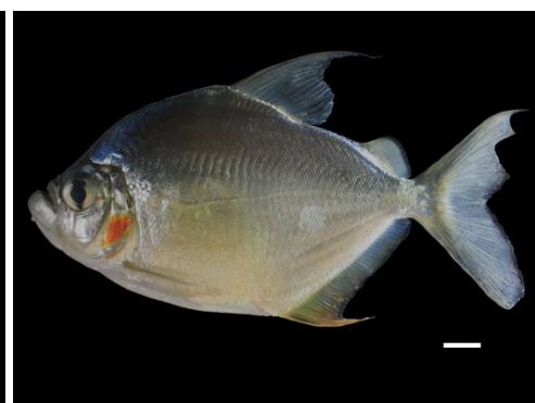
66 Catoprion mento SERRASALMIDAE Caribe