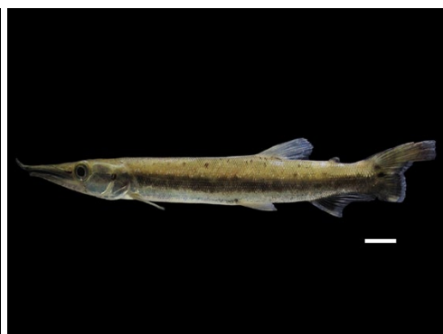
35 Boulengerella cuvieri CTENOLUCIIDAE Agujón