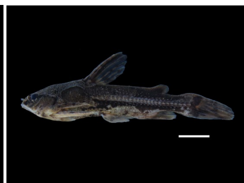
42 Amblydoras gonzalezi DORADIDAE Sierrita/Riqui-raque