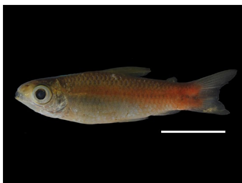
37 Curimatopsis evelynae CURIMATIDAE Tetra

[science.fieldmuseum.org/fieldguides] [1704] versión 1 12/2025