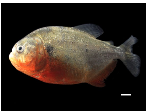
68 Pygocentrus cariba SERRASALMIDAE Caribe/Piraña