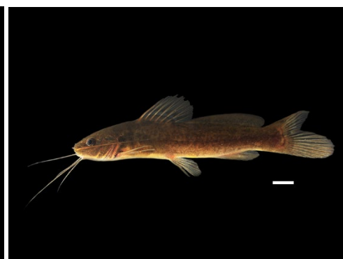
51 Rhamdia aff. laukidi HEPTAPTERIDAE Barbilla