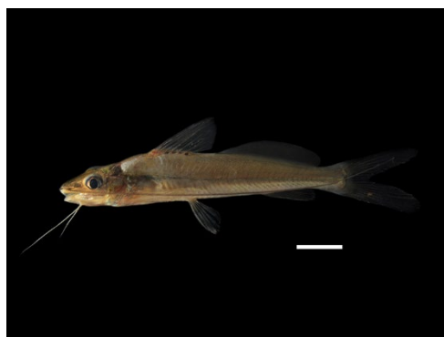
50 Pimelodella longibarbata HEPTAPTERIDAE Barbilla