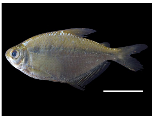
5 Gymnocorymbus bondi ACESTORRHAMPHIDAE Rosita/Sardina