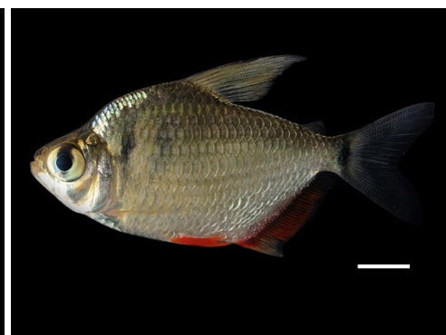
21 Tetragonopterus argenteus CHARACIDAE Peceta/Pechita