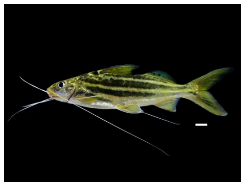
61 Pimelodus albofasciatus PIMELODIDAE Cuatrolineas/Nicuro