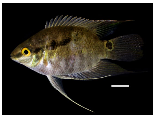
29 Mesonauta egregius CICHLIDAE Falso escalor/Mojarra lagunera