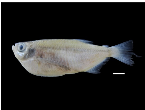
71 Triportheus venezuelensis TRIPORTHEIDAE Arenca