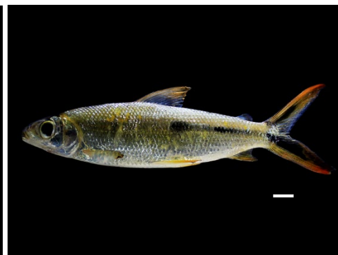
48 Hemiodus semitaeniatus HEMIODONTIDAE Saltón/Hemiodo colirojo