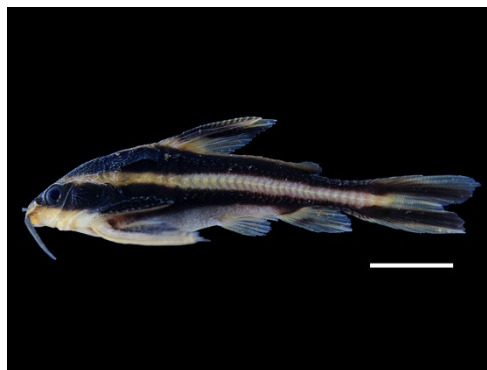
44 Platydoras armatulus DORADIDAE Riqui-raque/Siera caimana