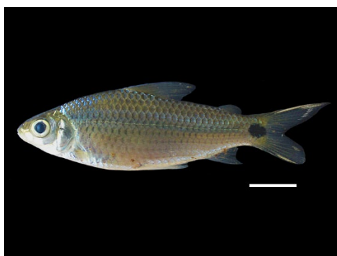
38 Cyphocharax spilurus CURIMATIDAE Coporo