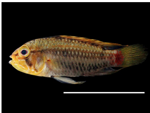
25 Apistogramma hongloi CICHLIDAE Apistogramma/Viejita