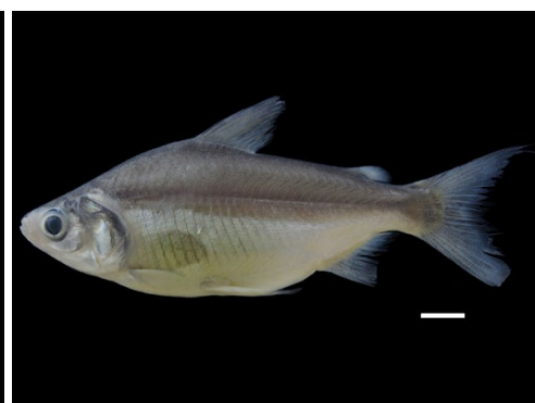
39 Potamorhina laticeps CURIMATIDAE Bocachico chillón