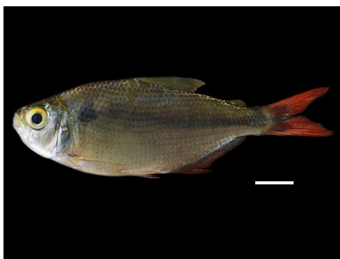
2 Astyanax integer ACESTORRHAMPHIDAE Sardina