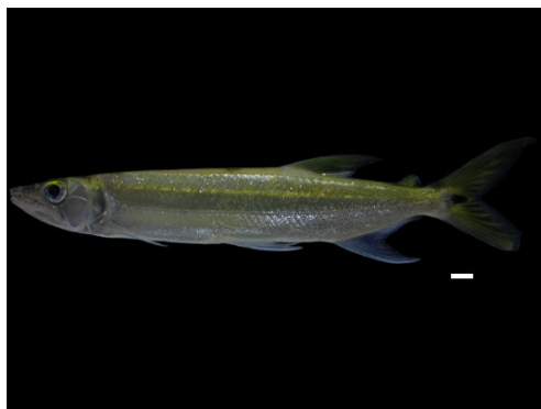
7 Acestrorhynchus microlepis ACESTORRHYNCHIDAE Dienteperro/Picuda