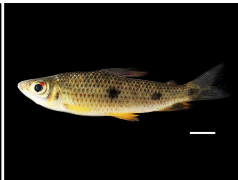
9 Leporinus friderici ANOSTOMIDAE Leporino/Mije