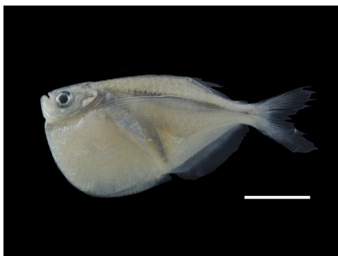
47 Thoracocharax stellatus GASTEROPELECIDAE Pecha/Pechona