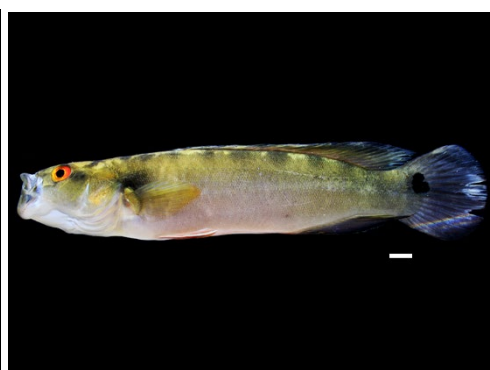
32 Saxatilia sp. CICHLIDAE Mataguaro/Bocón