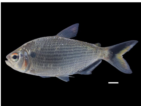
13 Brycon falcatus BRYCONIDAE Yamú/Pecha