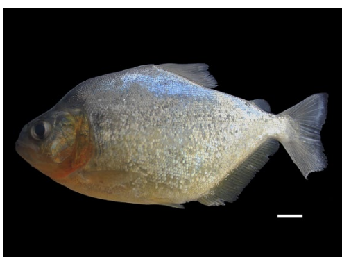
67 Piaractus orinoquensis SERRASALMIDAE Cachama blanca