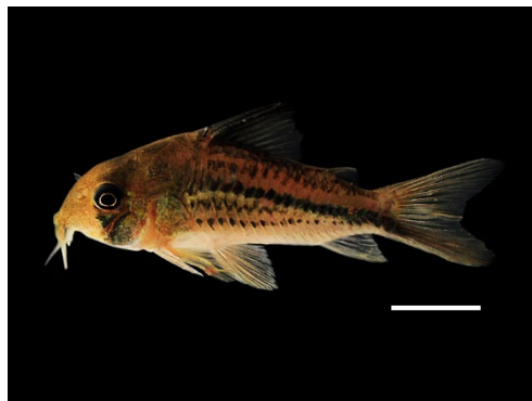
16 Hoplisoma sp. CALLICHTHYIDAE Corredora