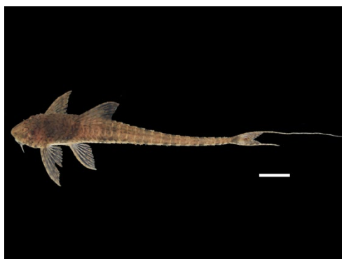
59 Rineloricaria eigenmanni LORICARIIDAE Alcalde