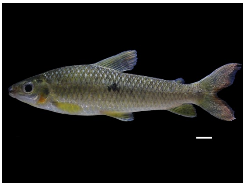
10 Megaleporinus sp. ANOSTOMIDAE Mije

[science.fieldmuseum.org/fieldguides] [1704] versión 1 12/2025