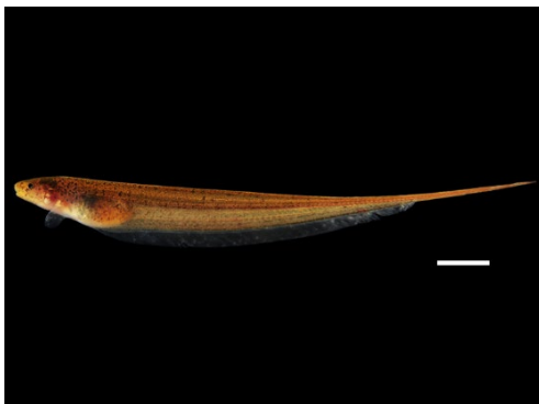
52 Brachyhypopomus brevirostris HYPOPOMIDAE Cuchillo