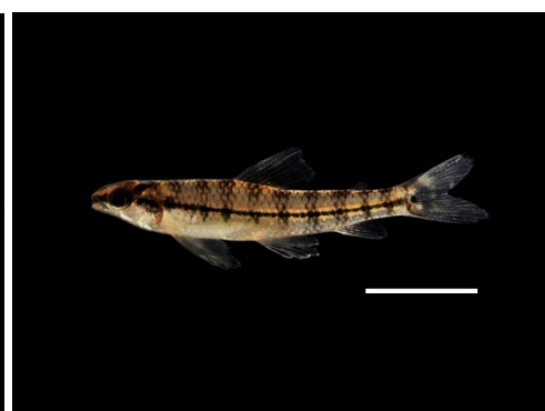
33 Characidium aff. zebra CRENUCHLIDAE Pencil/Mije