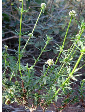
3 Borreria verticillata