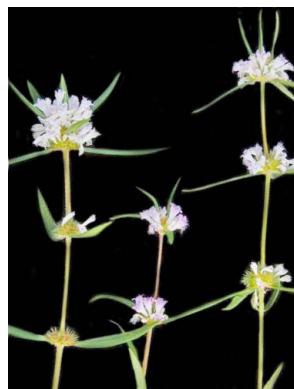
34 Staelia aurea