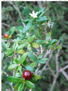
25 Margaritopsis carrascoana