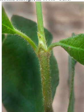
22 Guettarda angelica