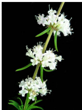
35 Staelia galioides