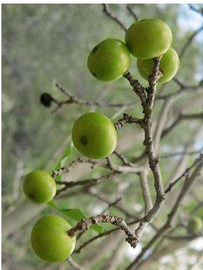
11 Cordiera sp