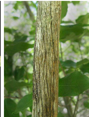
9 Cordiera sp