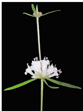
37 Staelia virgata