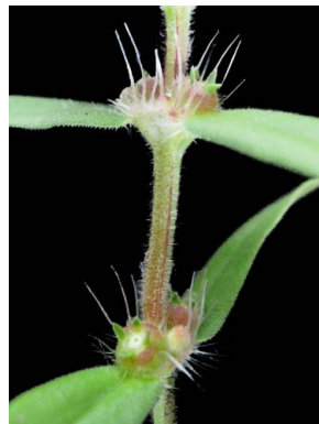
18 Diodella teres