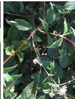
19 Emmeorrhiza umbellata