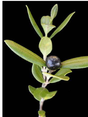
8 Cordiera rigida