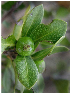
7 Cordiera rigida