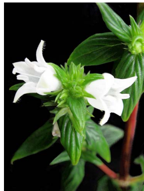
13 Diodella gardneri