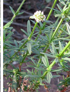
4 Borreria verticillata