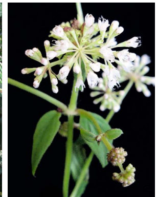
20 Emmeorrhiza umbellata