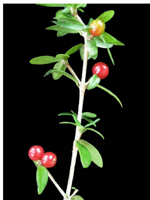
27 Margaritopsis carrascoana