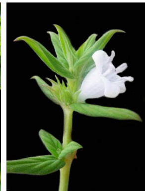
14 Diodella gardneri