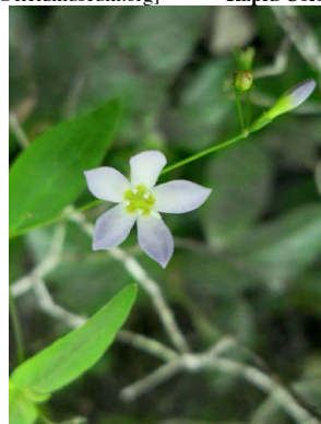
24 Leptoscela ruellioides