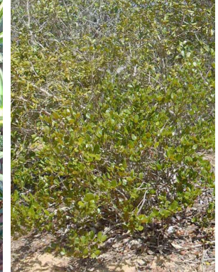
5 Cordiera rigida