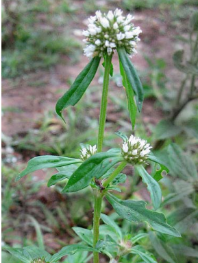
1 Borreria spinosa

Rapid Color Guide # 369 versão 1 09/2013