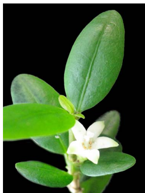
26 Margaritopsis carrascoana