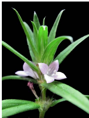
17 Diodella teres