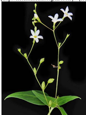
23 Leptoscela ruellioides