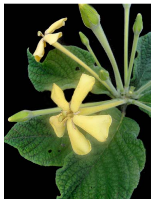
39 Tocoyena formosa