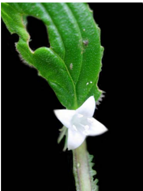
16 Diodella radula