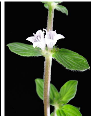
15 Diodella radula