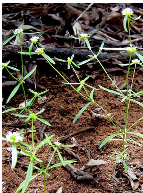
28 Mitracarpus baturitensis