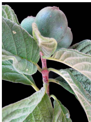
40 Tocoyena formosa