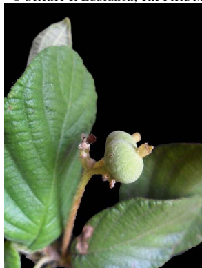
21 Guettarda angelica

Rapid Color Guide # 369 versão 1 09/2013