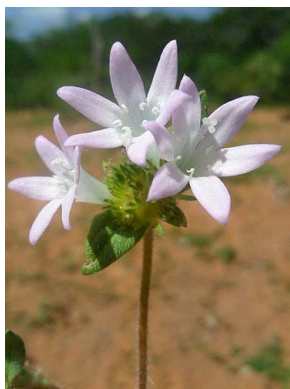
33 Richardia grandiflora