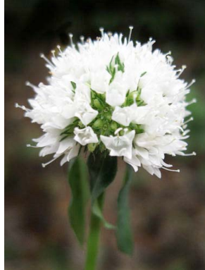
2 Borreria spinosa