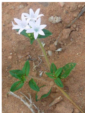
31 Richardia grandiflora