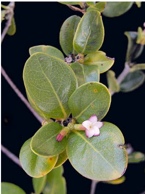
6 Cordiera rigida