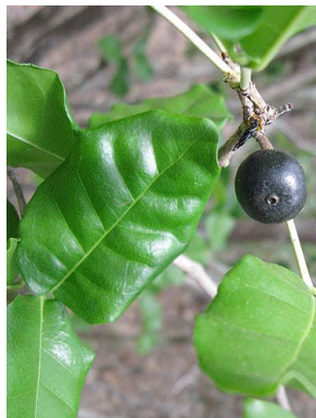
12 Calliandra surinamensis