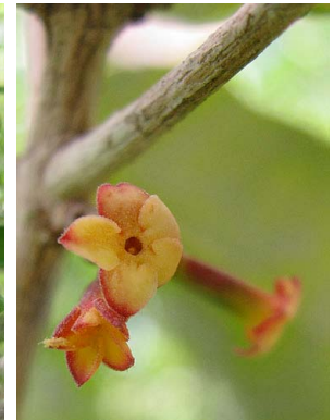
10 Cordiera sp