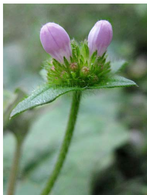
32 Richardia grandiflora