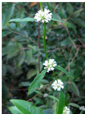
30 Mitracarpus robustus