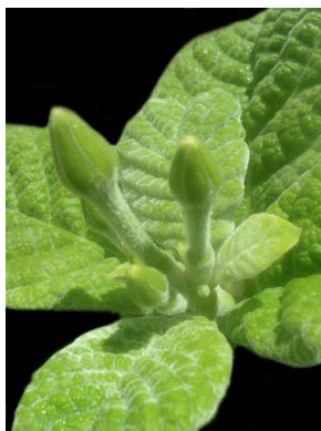
38 Tocoyena formosa