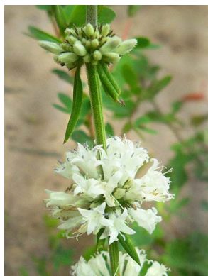
36 Staelia galioides